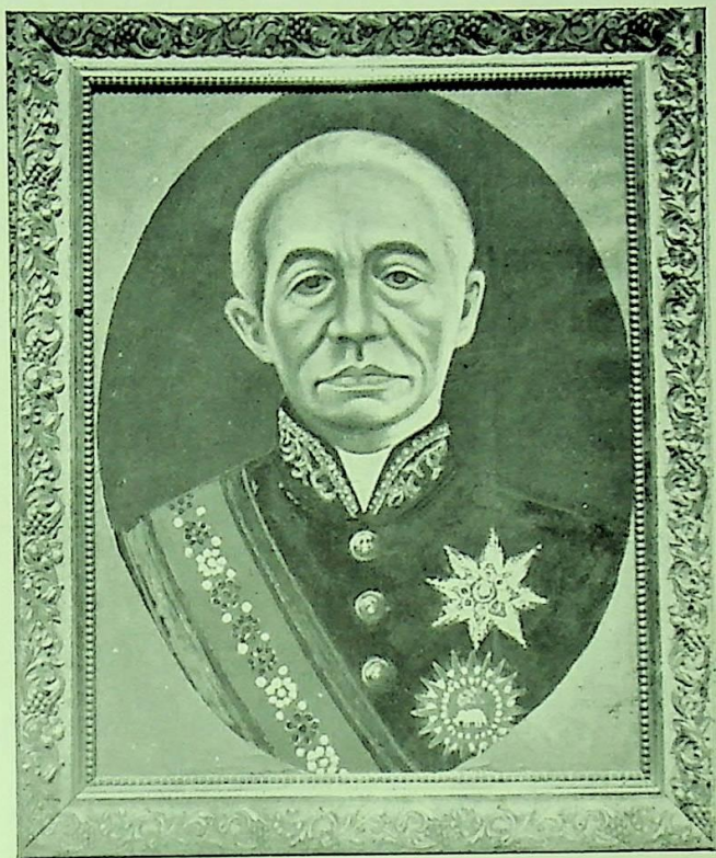
พระบรมรูปเขียนสีน้ำมัน พระบาทสมเด็จพระจอมเกล้าเจ้าอยู่หัว ที่เคยประดิษฐานอยู่ในห้องบรรทมของ พระเจ้าบรมวงศ์เธอ กรมหมื่นทิวาทรงยศประวดี