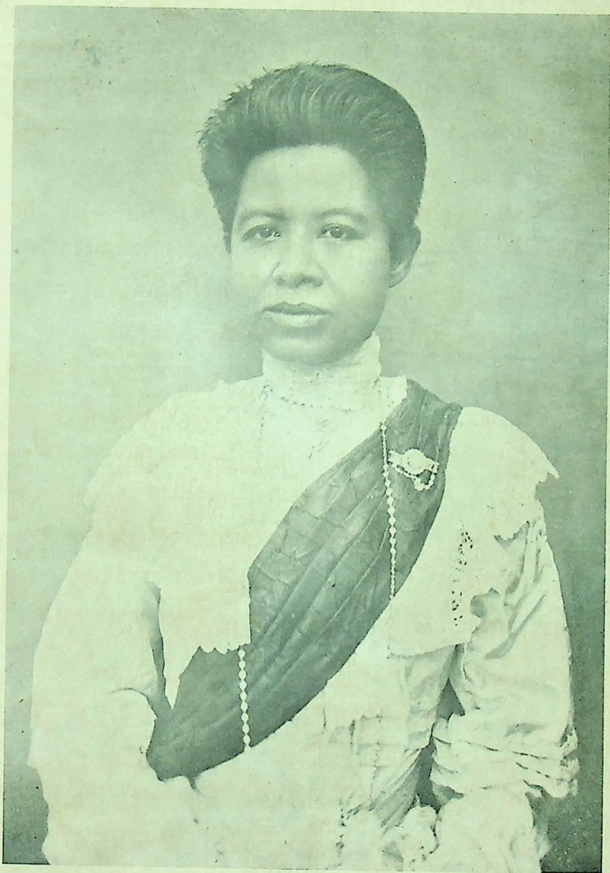
พระเจ้าบรมวงศ์เธอ พระองค์เจ้าพวงสร้อยสอางค์